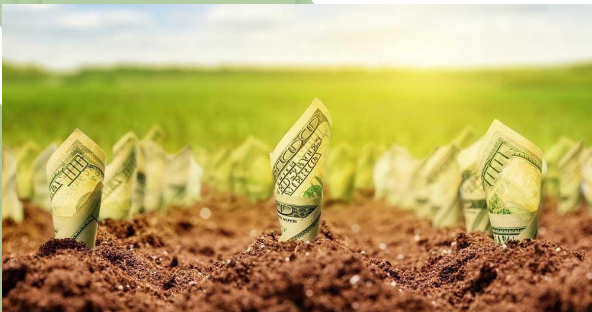
Figura 1. Representação figurativa do conceito de empresa rural.

Assim, surge o conceito de empresa rural: Unidade de produção que possui elevado nível de capital de exploração e alto grau de comercialização, isto é, elevado uso de fatores de produção como terra, máquinas, defensivos, entre outros, objetivando a exploração da capacidade produtiva do solo por meio do cultivo da terra, criação de animais e transformação de determinados produtos agropecuários. Em resumo, ambiente de produção agropecuário que possua administração e gestão de forma profissional, garantindo a máxima produção e lucratividade.