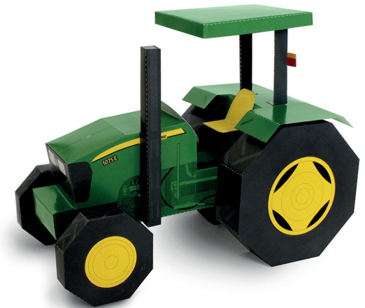
Exemplo do trator montado

Quando estiver pronto, tire uma foto e compartilhe conosco no f facebook.com/JohnDeere